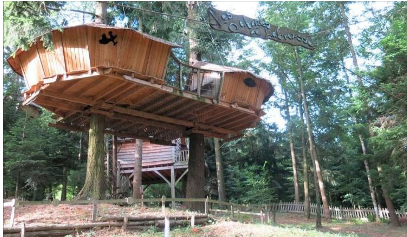
Les neuf cabanes, situées entre 4,5 et 10 mètres de haut, sont accessibles grâce à un escalier, ou une échelle de corde pour les plus aventuriers (ils doivent tout de même s'équiper d'un baudrier par sécurité).

Se réveiller au chant du coq et des oiseaux. Ouvrir les yeux et les fenêtres, et ne voir que la cime des arbres, la vallée de l'Eyrieux et, au loin, la chaîne des Cévennes. Voilà l'expérience vécue par neuf familles, ce matin de vacances estivales, aux "cabanes de Labrousse" (à Saint-Julien-Labrousse, près du Cheylard).