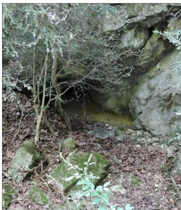
Un joli repaire à découvrir sous les branchages : « Loup, y-es-tu ? »

On sait qu'au début du XIX e siècle, de nombreux loups vivaient dans la plaine de la Valdaine et terrorisaient la population.